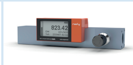
compact versions G1/2" Les versions 1/2" avec vanne manuelle sont pourvus de vanne fixée par bride