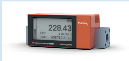
compact meter GCM Mesureur massique thermique compact switch GCS Mesureur avec fonctions alarme