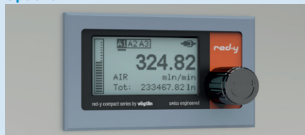
Kit de montage sur panneau