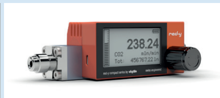
Raccords à étanchéité de surface