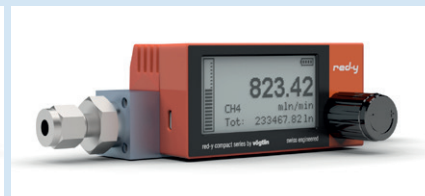
Divers raccords d'entrée et de sortie