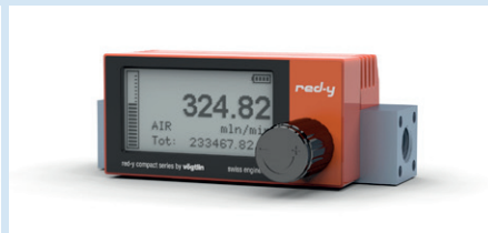
compact regulator GCR Mesureur avec vanne manuelle intégrée compact all-in GCA Avec vanne manuelle intégrée et fonctions alarme